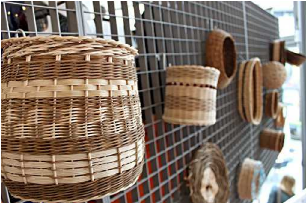
Eine ganze Wand voller Korbgeflechte